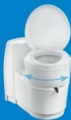
Model otočné mísy

Dokonalé řešení domácí toalety vestavěné do rekreačního vozidla