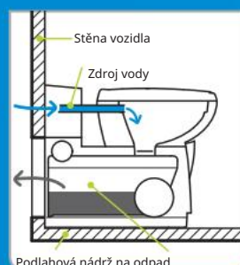
Podlahová nádrž na odpad

Naplňte centrální nádrž na vodu přes externí přípojku vody.