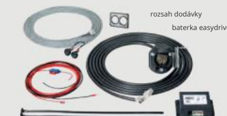
rozsah dodávky baterka easydriver